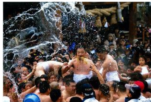
勇壮果敢な破魔弓祭(的ばか)