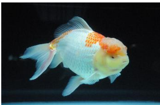
長洲町の特産品 泳ぐ宝石 金魚

長洲町は、熊本県の北部に位置しています。(北緯:32度55分35秒 東経:130度27分02秒)西・南部は有明海に面し、対岸には島原半島を望み、北は荒尾市と隣接、東部は県立公園小岱山を擁して、南東部を流れる行末川を境に玉名市と接した面積19.44平方kmの町です。九州鹿児島本線が北西から南東に町を走っています。また、海上は長洲港と長崎県の多比良港とを結ぶ有明フェリーが運航しており、交通の便に恵まれています。有明海の恵みを受け温暖で暮らしやすい気候のもとで、豊かな自然と、工業地帯が共存する町として発展しています。