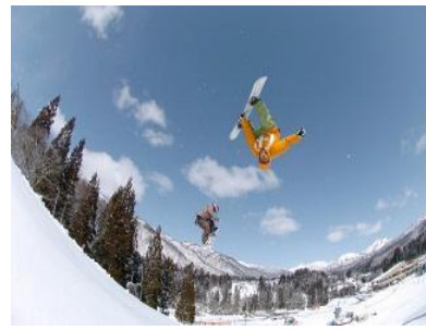
冬はスノーボーダーやスキーヤーで賑わう