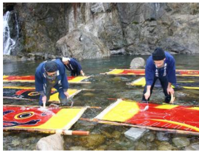
冬の風物詩 鯉のぼりの寒ざらし