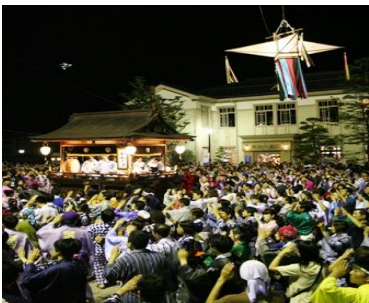
重要無形民俗文化財 郡上おどり

夏は郡上おどりが有名で多くの観光客で賑わうほか、市内には多くのスキー場やキャンプ場があり、年間620万人が訪れます。