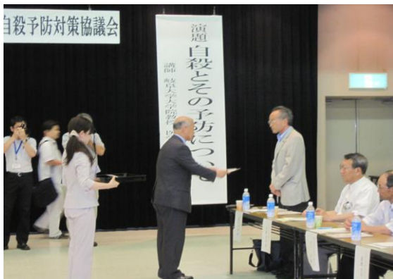
平成22年7月に郡上市自殺予防対策協議会を設立